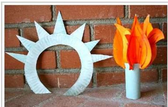
Statue of Liberty Craft using paper plates!

Sjeverna Amerika - Kip slobode (za glavu, plamen- rola papira) + plastelin